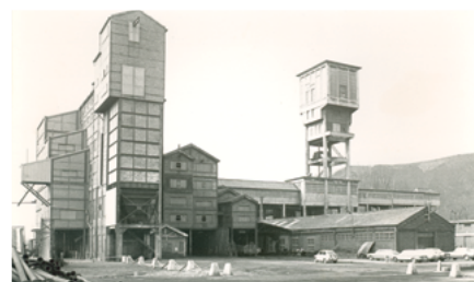
De installaties van Schacht 1 in de jaren 1970