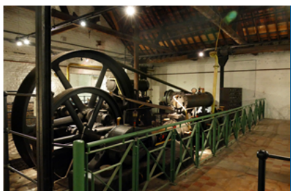
Binnen de Schacht Marie

Schacht “Marie” dateert uit de negentiende eeuw (1849). Ze heeft tot 1887 dienst gedaan als hoofdschacht en vervolgens tot 1983 als luchtuittrekkende schacht. Ze had een diepte van 234 meter en is uitgerust met metalen schachtbok. De schacht bevindt zich in een veelomvattend technisch gebouw dat in een zeer goede staat bewaard gebleven is waar zich de ventilators, de douches, de lampenzaal, de compressorenzaal, het rapportenbureau, enz. ... bevinden.