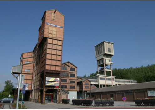
De zeverij-wasserij en Schacht 1

De sluiting had tot een definitief einde van de steenkoolmijn van Argenteau kunnen leiden. Ze zou zo verkommerd zijn tot een industriële ruïne, blootgesteld aan vandalisme en wildgroei.