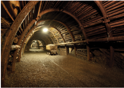
Galerij van de mijn